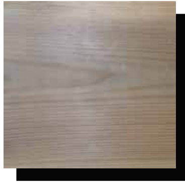
Holz nach ca. 6. Monaten