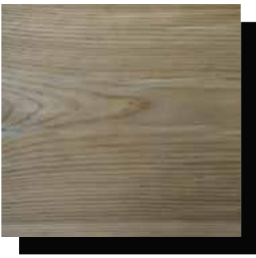
Frisches Holz 3–5 Tage