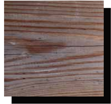
Über ein Jahr altes Holz